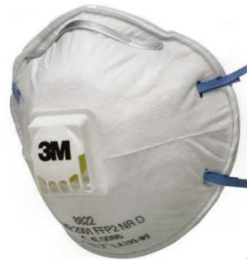
Foto 1. Esempio maschera con valvola