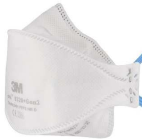
Foto 2. Esempio di maschera FFP2 senza valvola

I locali e gli impianti di aria condizionata sono sanificati rispettivamente con cadenza giornaliera e settimanale con prodotti a base di cloro, alcool. Ove presente, è stata inoltre interrotta la funzione di ricircolo degli impianti aeraulici.